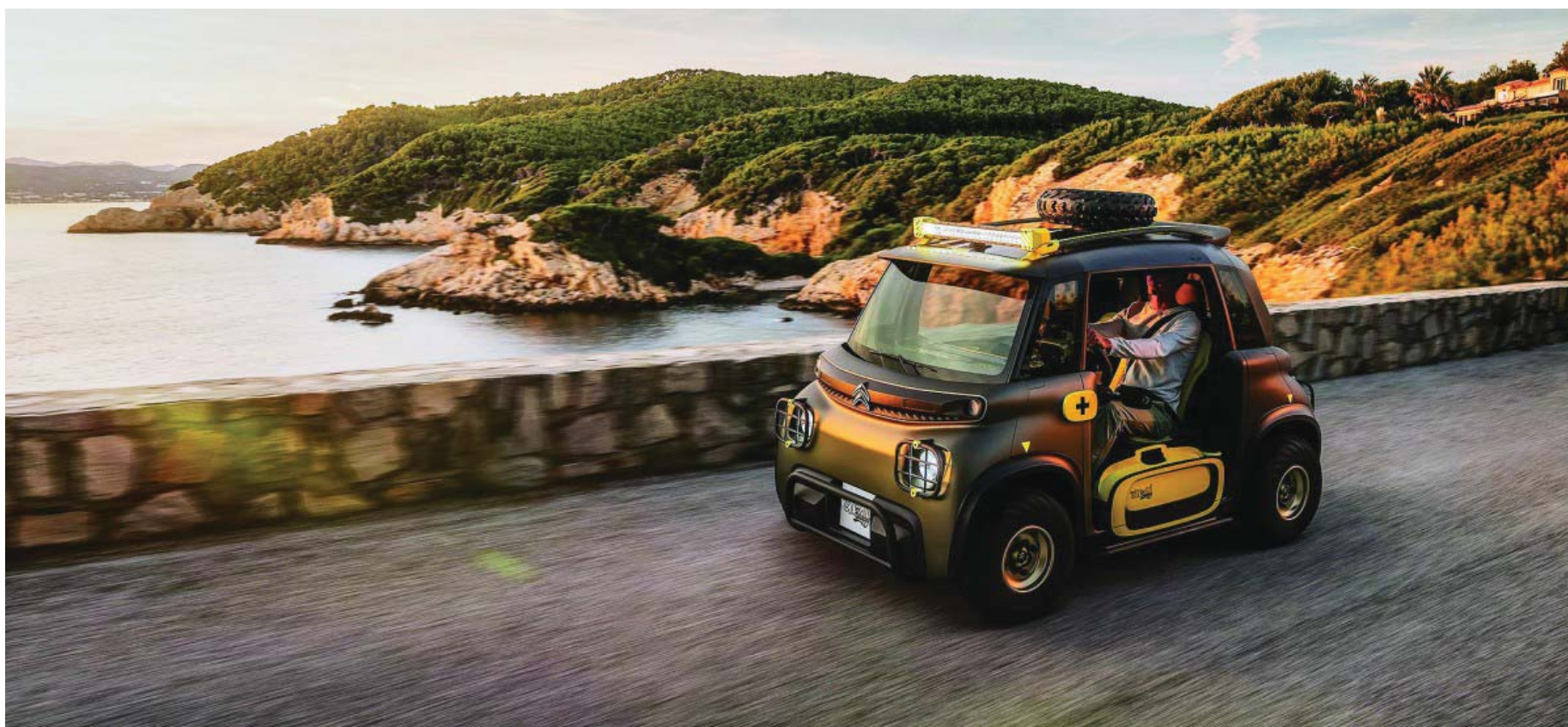
Este vehículo cien por cien eléctrico tiene una autonomía de 70 kilómetros y se puede cargar en un enchufe doméstico