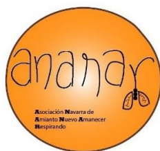
Ananar Asociación Navarra de Amianto Nuevo Amanecer Respirando