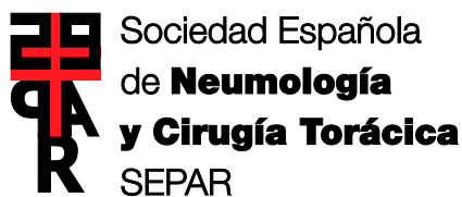
Sociedad Española de Neumología y Cirugía Torácica SEPAR