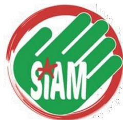
SIAM de Apoyo Mútuo