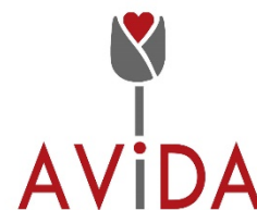
Avida Asociación de Víctimas del Amianto