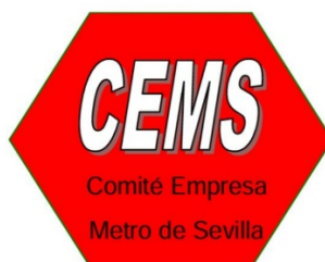
Comité de Empresa Metro Sevilla