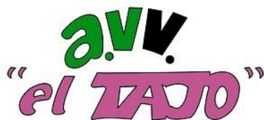
Asociacion de Vecinos El Tajo