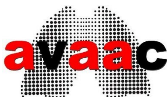
AVACC Asociación de Víctimas Afectadas por el Amianto en Cataluña