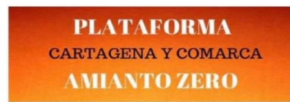
Amianto Cero Cartagena y Comarca