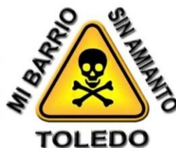
Mi Barrio sin Amianto