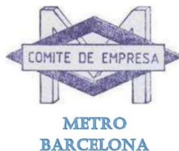
Metro de Barcelona (FMB) - Comité de Empresa