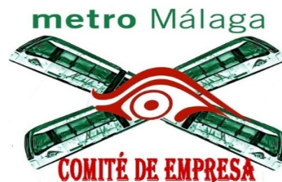
Comité de Empresa Metro Málaga