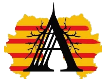
A4 Asociación de Afectados/as por el Amianto en Aragón