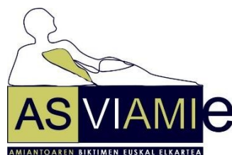
Asviemie Asociación de Víctimas del Amianto de Euskadi