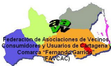
Federación de Asociaciones de Vecinos, Consumidores y Usuarios de Cartagena y Comarca «Fernando Garrido»