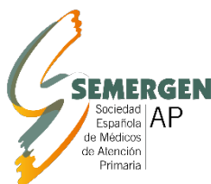
Sociedad Española de Médicos de Atención Primaria