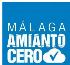
Málaga Amianto Cero