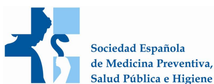
Sociedad Española de Medicina Preventiva, Salud Pública e Higiene