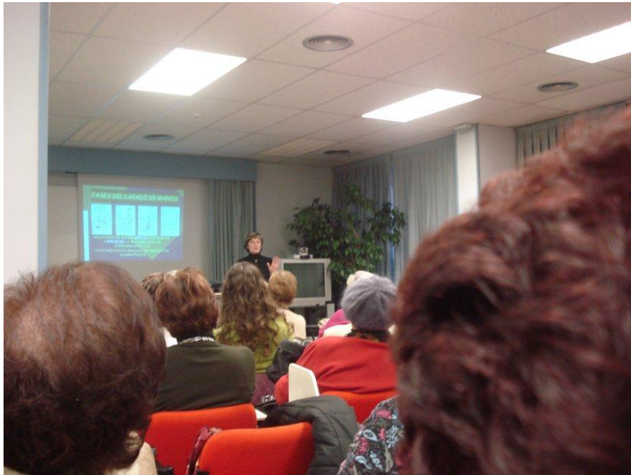
1º) Curso de manipulación de alimentos para las voluntarias que elaboran las pastas