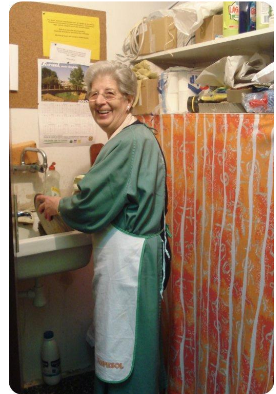
2º) Elaboración de las pastas en la sede