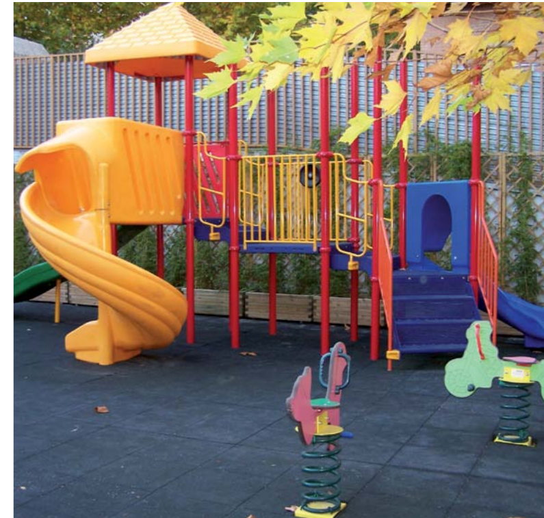
■ Zona infantil de la residencia oncológica de la aecc en Madrid