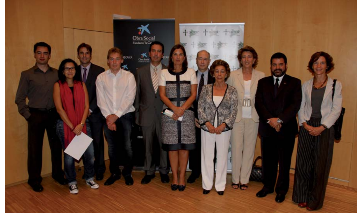
Acto de entrega de Ayudas a la Investigación adjudicadas en Barcelona

por la Agencia Nacional de Evaluación y Prospectiva (ANEP), lo que añade una garantía de calidad a los proyectos financiados por la Fundación.