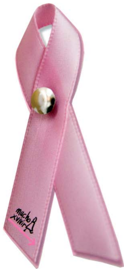
Los programas en cifras