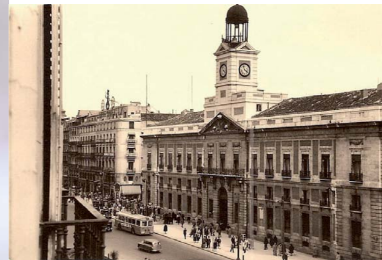
■ Puerta del Sol de Madrid en el año 1953

Y la leyenda narra la historia de un hombre que, conmovido por aquel relato, decidió crear una asociación que pudiera aliviar las amarguras que causaba esta enfermedad. Hombre de negocios, sabía que necesitaba fondos para el proyecto: así que acudió al lugar donde podía conseguirlos. Dicen que fue en una cacería donde, ante personas influyentes, extendió su capa en el suelo y rogó que depositaran los primeros donativos para iniciar lo que hoy es ya una gran asociación.