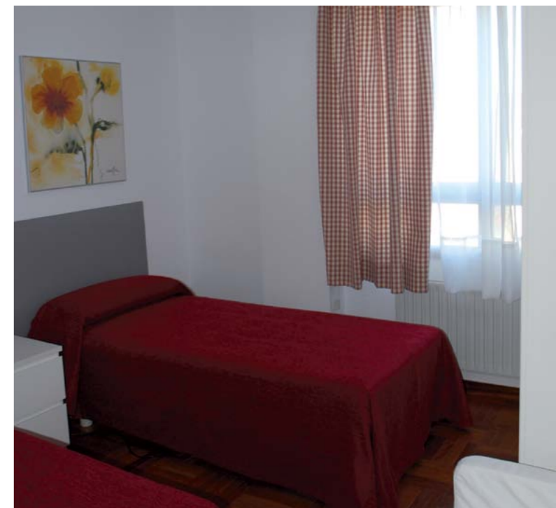
■ Nuevo piso de acogida de la aecc en Burgos

Con estas tres últimas inauguraciones en las ciudades castellano leonesas, la aecc cuenta ya con 31 pisos y residencias en toda España, que ofrecen un entorno afectivo adecuado cercano al hospital. Gestionados por las distintas Juntas Provinciales, los pisos y residencias cuentan con profesionales y voluntarios que dan respuesta a todas las necesidades de los pacientes y sus familiares.