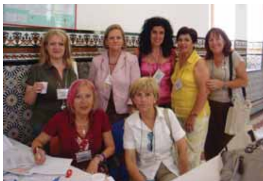
Participantes en las jornadas.

La Junta Provincial de Málaga, ha celebrado las Jornadas Provinciales de Voluntariado Social, en el Centro Cívico de la Diputación Provincial de Málaga. Su organización ha estado a cargo de la junta Comarcal de Fuengirola.