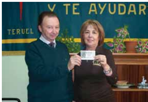
Mostrando el décimo agraciado repartido por la Junta Provincial de Teruel.

“Frente al cáncer todos somos uno” ha sido, un año más, el lema de la campaña con el que la aecc quiere transmitir la importancia de que cada uno de nosotros tome conciencia de que sólo uniendo esfuerzos es posible ganar terreno al cáncer.