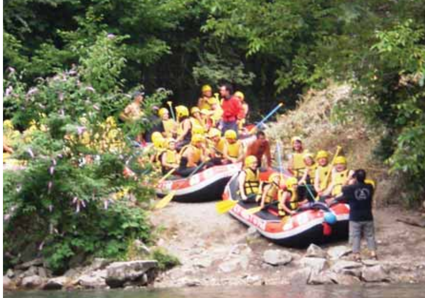
Actividades rafting en los campamentos.