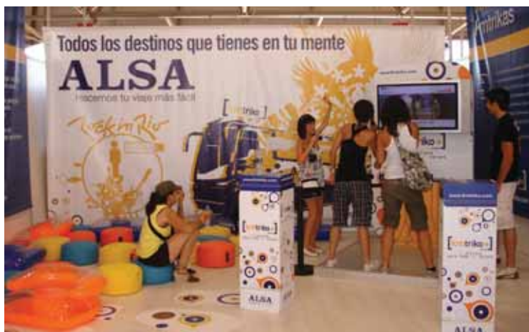
Stand de Alsa en Rock in Río.

Queremos agradecer a ALSA su colaboración con la aecc y el reconocimiento que ha tenido con su labor y con todos los que formamos parte de ella.