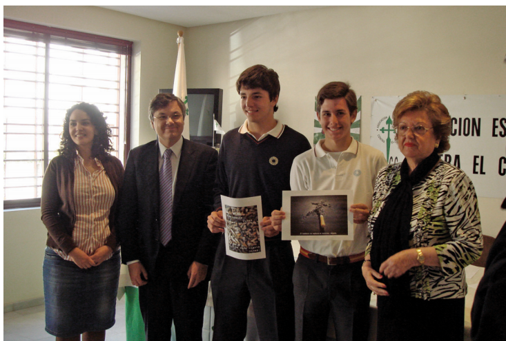
Premio del concurso “Acaba con Piti” de Badajoz.

La gran novedad este año ha sido la edición de un vídeo en el que se veía a Piti intentando sobrevivir a su decadencia y al abandono de un fumador. Su difusión se realizó a todos aquellos que se acercaban a las mesas de la aecc mediante bluetooth, y se podía visitar tanto en www.loestoydejando.org como en diversos portales destinados a jóvenes.