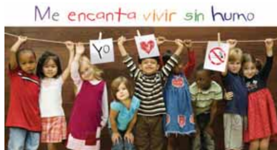
Cartel 4 de febrero, día mundial contra el cáncer UICC-aecc.

Un día dedicado a concienciar sobre la importancia de combatir el tabaquismo pasivo en los niños y en el que precisamente ellos fueron