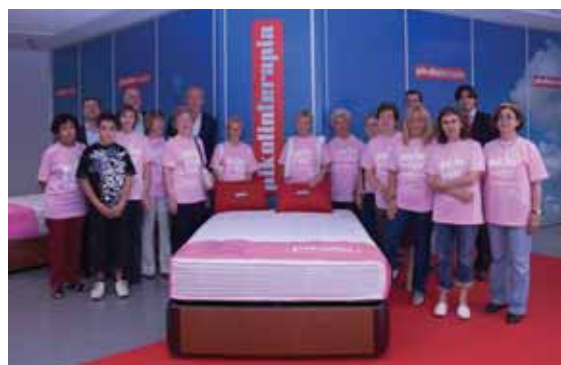
Visita a la fábrica de Pikolín de un grupo de voluntarios de MuchoxVivir de Zaragoza.

Es el segundo año en que Pikolín pone en marcha la iniciativa del "colchón solidario", por la que destina parte de los beneficios de la venta de este producto al programa MuchoxVivir de lucha contra el cáncer de mama.