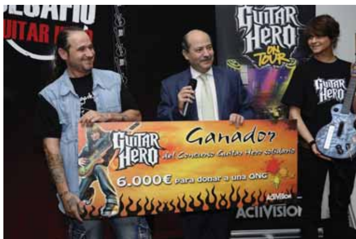
Entrega del cheque a la aecc .

No es la primera vez que Mago de Oz colabora con la aecc , y de nuevo ha querido favorecer con su ayuda al proyecto aeccjunior de la planta de Hemato-oncología pediátrica del Hospital Doce de Octubre de Madrid. La diseñadora Ana Locking por su parte destacó