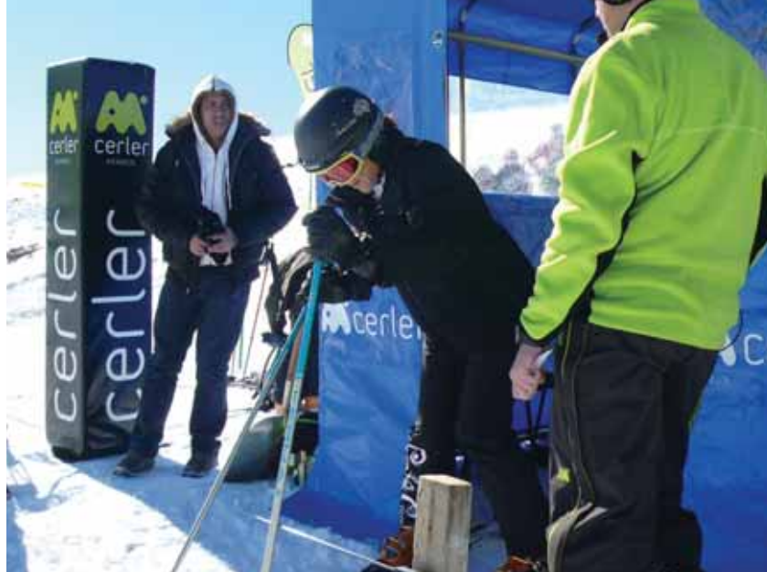
Salida de Blanca Fernández Ochoa.