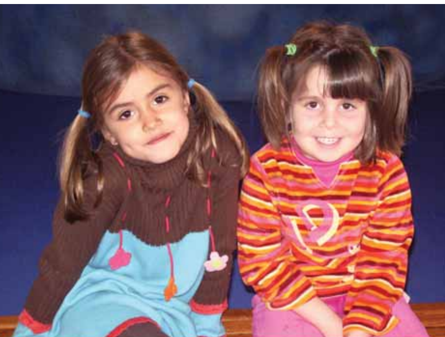
Niñas participantes en el vídeo para pedir a los padres que dejen de fumar.