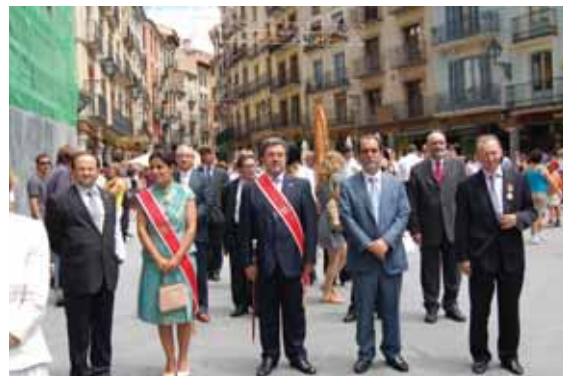
Medalla de Oro de Teruel.