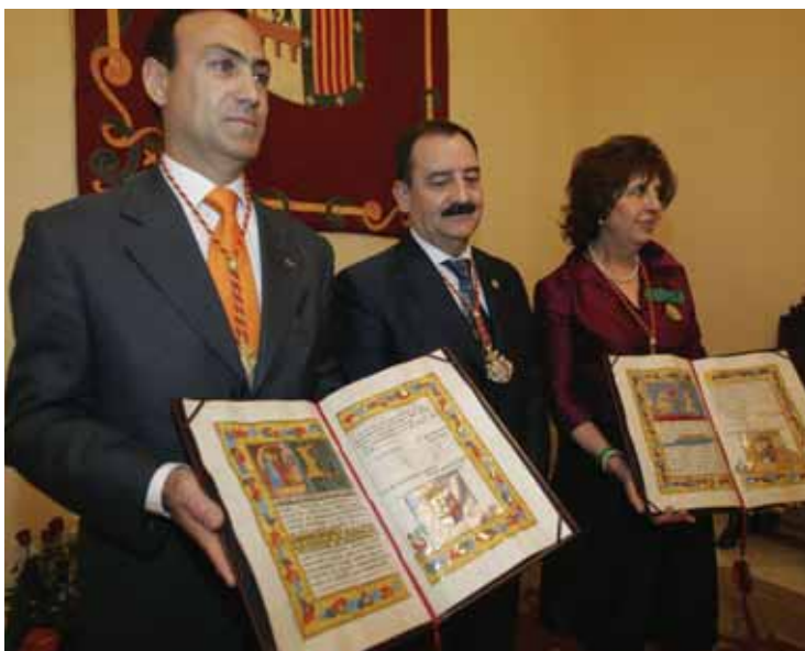
Medalla de Oro de Salamanca.

En un acto que tuvo lugar el pasado 11 de junio, la Junta Provincial de la aecc en Salamanca fue galardonada con la Medalla de Oro de la ciudad por su permanente implicación y compromiso frente al cáncer. El consistorio salmantino concede esta distinción a aquellas entidades que, por sus obras o actividades y servicios a favor de la ciudad hayan destacado notoriamente, haciéndose merecedores del reconocimiento del pueblo salmantino. El jurado ha destacado "la labor encomiable con los enfermos y sus familiares" que realiza la aecc , que cuenta con un servicio de voluntariado en el Hospital Clínico Universitario de Salamanca, además de nueve profesionales y numerosos socios y colaboradores.