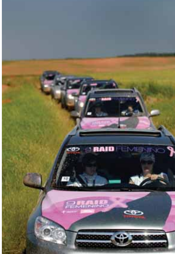
Caravana de todoterrenos en ruta.

El Raid Femenino "Mucho x vivir" llega en 2008 a su novena edición. Un año más, Toyota, organizador de este proyecto, colabora con la aecc como plataforma de comunicación de su programa "Mucho x vivir" .