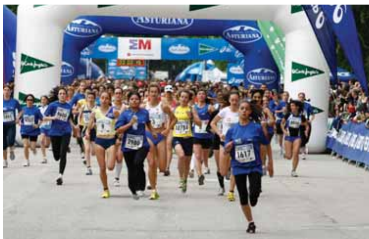
Salida de la carrera de la mujer.

En la prueba celebrada en Madrid se recaudaron 12.000 euros para la aecc y se hizo entrega del dorsal 100.000, a la madrileña que se alzó con ese número de inscripción en el que hoy por hoy es el mayor evento deportivo femenino de toda Europa.