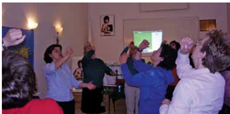
Momento del taller.

Dicen que cuanto más ríes más vives. Y lo cierto es que hay estudios que demuestran que la risa es buena para la salud, el equilibrio emocional,