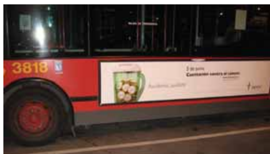
Campaña en autobuses con la colaboración de la EMT.

A ellos, a los voluntarios y a todos vosotros, ¡Gracias por ayudarnos!