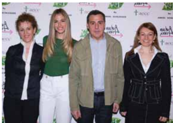
Rueda de prensa presentación de la campaña con Angel Schlesser y Martina Klein.

V&T ha demostrado ser mucho más que un refresco saludable con la creación de una colección, diseñada por el prestigioso diseñador Angel Schlesser e inspirada en el espíritu de la firma, cuyos beneficios irán desti-