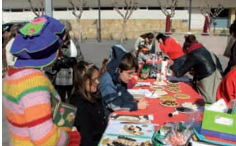
Talleres en la calle con motivo del 4 de febrero.