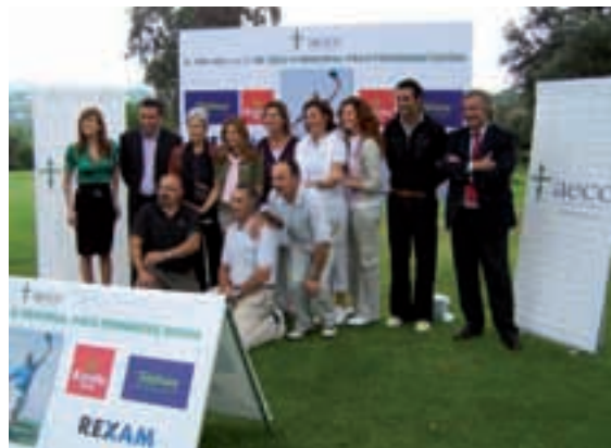
Algunos rostros conocidos en el torneo de golf.

Agradecemos desde aquí la presencia de todos ellos, así como la colaboración de todas aquellas empresas e instituciones que colaboraron en la organización y patrocinio del torneo, cuya recaudación se destinará a proyectos de investigación oncológica: Ya2 Eventos, Te-