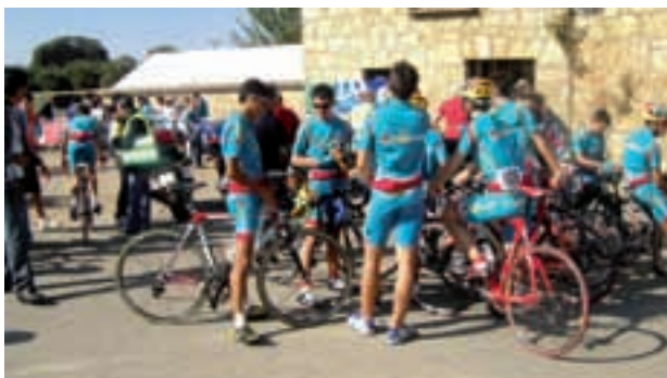
Participantes en la cronoescalada contra el cáncer.

Agradecemos tanto a la Unión Ciclista de Palencia como a la Junta Provincial de Palencia por la realización de este proyecto en el que alrededor de 250 participantes mostraron su implicación y solidaridad en la lucha contra el cáncer.